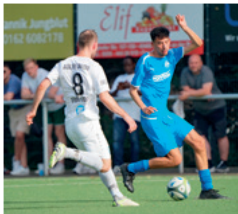
Gegen den Oberligaabsteiger Adler Union Frintrop musste sich die Rehmannelf 2:4 geschlagen geben. Nach der guten ersten Halbzeit konnte die Mannschaft das Niveau in der zweiten Hälfte nicht mehr halten.