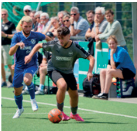
Keine Chance hatte der SV Burgaltendorf am 7. Juli beim 6:3-Erfolg. Bereits nach vier Minuten stand es 2:0 für die SGS.