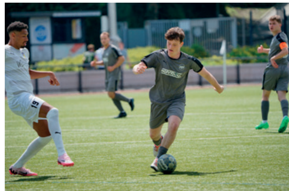
Bereits in den Testspielen der Dritten war zu sehen, dass sie mit viel Tempo die Aufgaben angehen wollen.