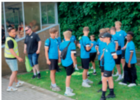
Die Spieler der C2 sorgten als Balljungen dafür, dass keine Verzögerungen ins Spiel kamen.

der SGS – teilten sich die Moderation und bekamen die Trainer vor dem Spiel und sport-