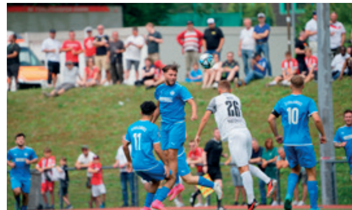
Im ersten Spiel am 29. Juni hielten die Jungs beim 0:5 gegen den Drittligisten Rot-Weiss Essen lange gut mit.

Wir haben die Partien und Ergebnisse in Bildern, die unsere Fotografen Kurt Nauroschat und Marc Pastoors „geschossen“ haben, für Euch chronologisch aufbereitet.